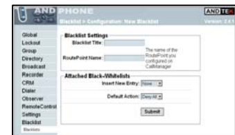
Web basierende Administration

Die Administration des Moduls erfolgt mit der webbasierten Administrationsoberfläche des AND Phone Application Servers und integriert sich damit nahtlos in die bestehende Umgebung.